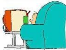
Figura 1 – Homem vendo televisão