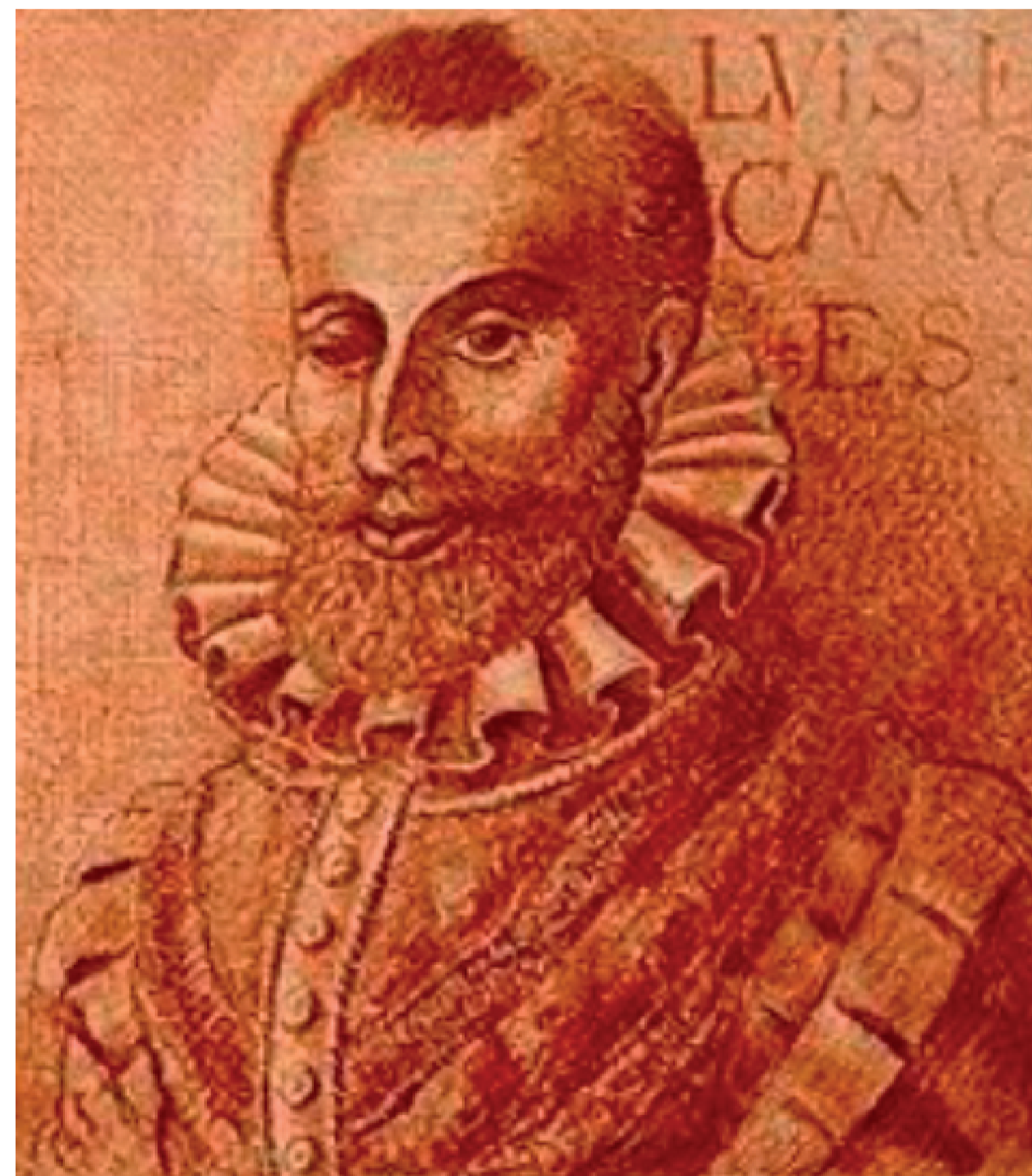
Figura 1 O retrato de Camões Fonte: Fernão Gomes

As figuras são peças-chave em um pôster e devem ter um grande destaque. São elas que, em um primeiro momento, fisgarão os visitantes. Em um segundo momento, são as figuras que vão ajudar a dar sustentação aos seus argumentos, de maneira muito mais eficaz do que os textos, quando bem combinadas com os diagramas e esquemas. Nunca deixe de citar as fontes das figuras que pegar emprestadas.