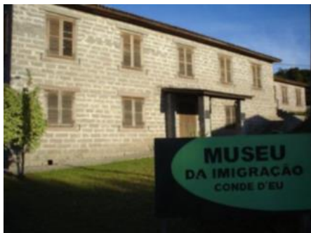
Figura 1 – Museu ao Ar Livre em Orleans – SC