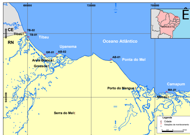
Figura 3: Evolução da população em diversas regiões do país.

Exemplo: para o caso de uma 3ª figura exposta no artigo.