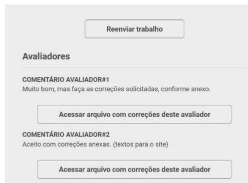
Figura 3 – Parte do e-mail recebido pelo autor para acessar as correções e reenviar o artigo revisado.

12. Ao ser “Aceito com modificações”, você deverá visualizar as correções/sugestões do(s) avaliador(es), conforme a (Figura 3) abaixo;