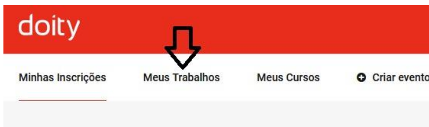
Figura 2 – Link do menu para acessar seu artigo (trabalho)

11. Após a avaliação do seu artigo, você receberá um e-mail “Submissão de trabalho” do evento, com os pareceres dos avaliadores;