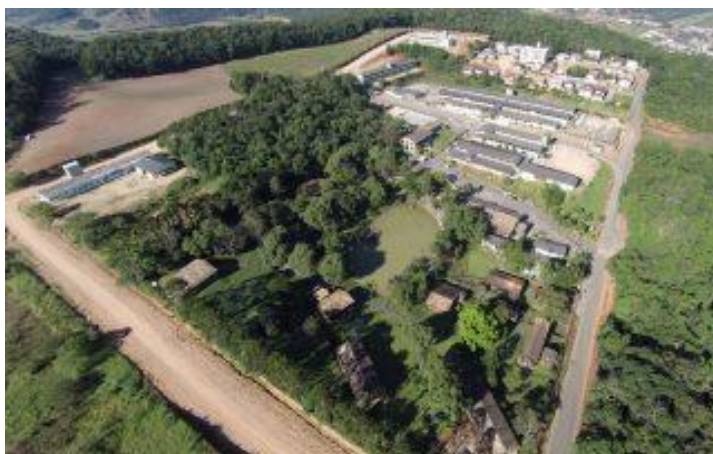
Figura 1 – Campus UNIBAVE Orleans – SC

O tamanho de fonte utilizada no corpo das tabelas não poderá ser superior a 12 ou inferior a 10. Não devem ser inseridas no artigo, tabelas em formato de imagem.