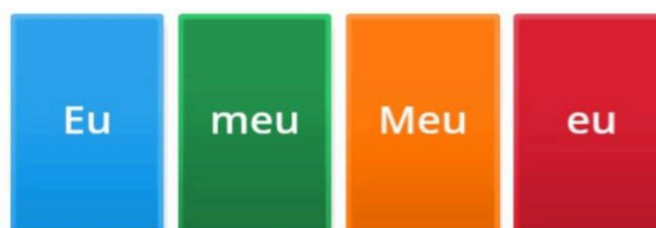
Figura 1: primeiro modelo de atividade feita no Wordwall para a aluna.

Assim, utilizando a ferramenta tecnológica, em locais mais tranquilos e seguindo o ritmo da educanda, a mediadora apresentou a atividade de identificação dos pronomes na letra da música, através de recursos que a aluna também utilizava, como