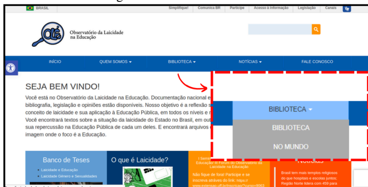
Figura 3 - Print do site do OLE.