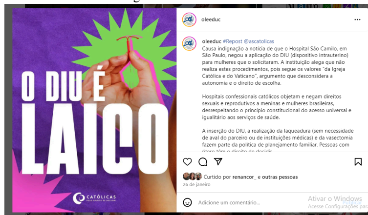
Figura 2 – O Diu é Laico.