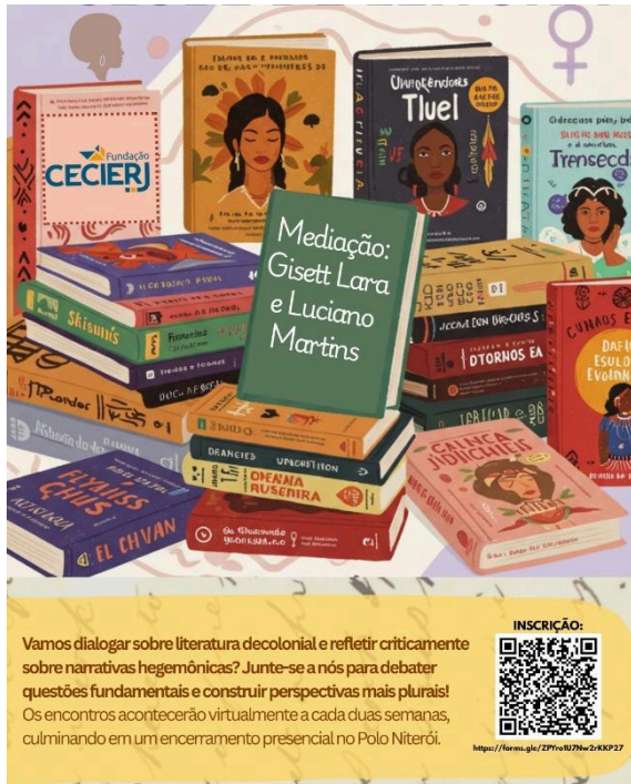
Figura 2 – Arte de divulgação do Clube de Leitura: Práticas Leitoras Decoloniais, com informação de inscrição e QR Code.

autorias como as escritoras negras brasileiras Carolina Maria de Jesus, Conceição Evaristo, Barbara Carine, a escritora indígena Gení Ñunez; o escritor indígena Ailton Krenak; a escritora negra estadunidense bell Hook e por fim, a escritora não-binária Jota Mombaça. Num fundo rosa claro, com figuras de flores e letras na cor lilás sobre o nome do clube.” Fim da descrição.