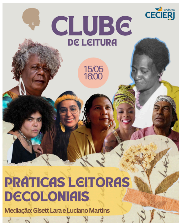
Figura 1 – Arte de divulgação do Clube de Leitura: Práticas Leitoras Decoloniais.