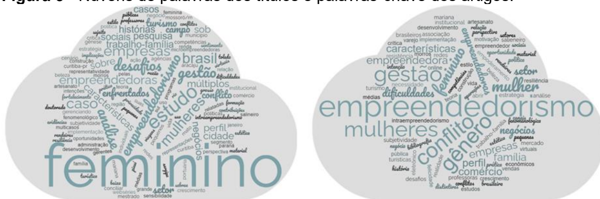
Figura 3 - Nuvens de palavras dos títulos e palavras-chave dos artigos.