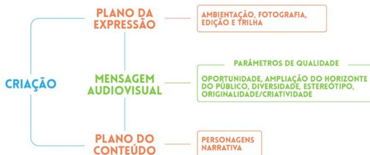
Figura 3. Parâmetros de análise da criação audiovisual

Neste momento, acionamos o eixo de criação audiovisual a partir da proposta teórico-metodológica de Borges e Sigiliano (2021) [Figura 3], realizando uma análise dos episódios da série a partir dos planos do conteúdo e da expressão. Com isso, salientamos como o tom de fábula colabora com a humanização dos personagens híbridos e com um olhar de empatia para outras espécies. A composição visual e a ambientação da série também foram destacadas, chamando atenção para como espaços naturais e urbanos são contrapostos, com os primeiros sendo ambientes de resistência enquanto os segundos trazem a sensação de hostilidade e perigo.