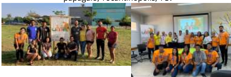
Figura 1 – Coordenadores e monitores da Universidade da Maturidade do bico do papagaio, Tocantinópolis, TO.