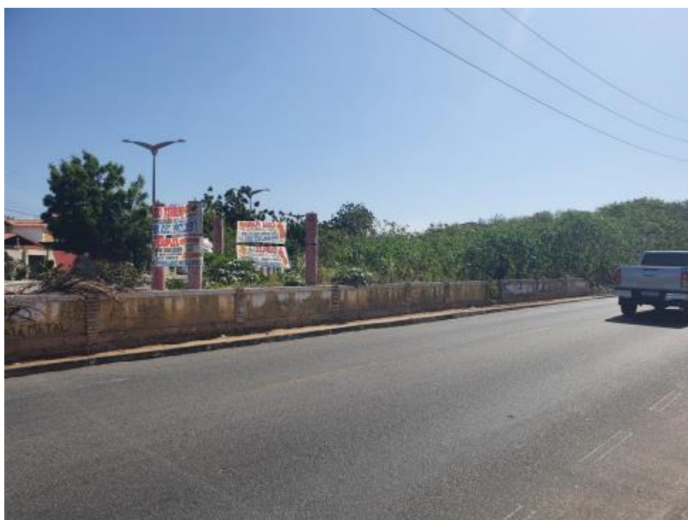
Figura 2 – Terreno subutilizado localizado na Avenida José Leon, um lote cercado por um muro baixo, marginalizado e desgastado, com presença de vegetação espontânea, sugerindo abandono.

Em Fortaleza, os microparques urbanos surgem como estratégia inovadora para enfrentar a crise climática e recuperar áreas degradadas, sobretudo em bairros de baixa renda, promovendo benefícios como redução de temperatura, aumento da infiltração da água, controle da inversão térmica e criação de refúgios para fauna contribuindo para restabelecer o equilíbrio ecológico perdido pelo avanço da urbanização (Panizza, 2024). (Figura 2 e Figura 3).