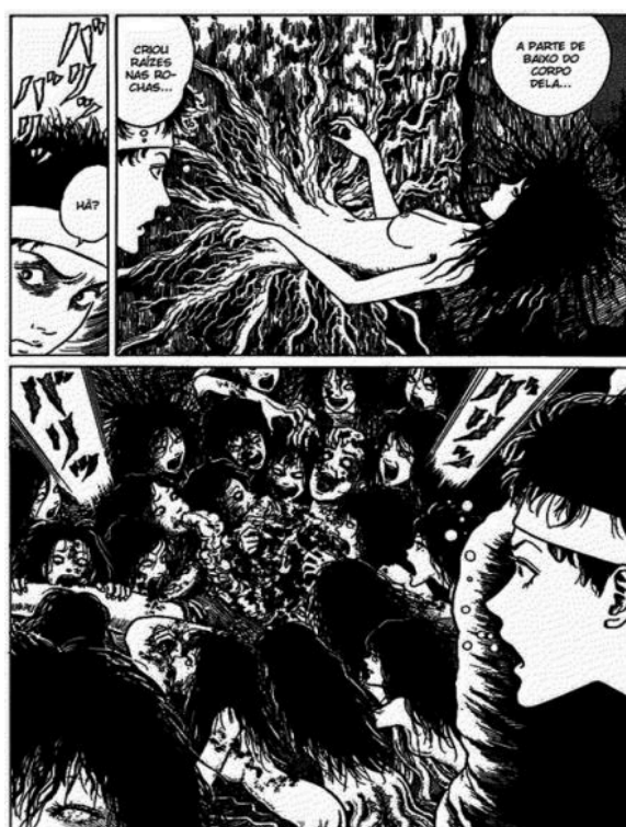
(Ito, 2021, p. 249)

É ainda interessante a maneira como Tomie pode transmitir sua personalidade e sua aparência para outras pessoas. No episódio em que Yukiko recebe um rim transplantado, o órgão contaminado pela essência monstruosa faz com que a jovem se transforme em uma réplica exata do corpo desejoso de Tomie. Além disso, a personagem provoca delírios em uma menina cujo corpo entra em contato com seus fios de cabelo: ao ter o cabelo de Tomie colado