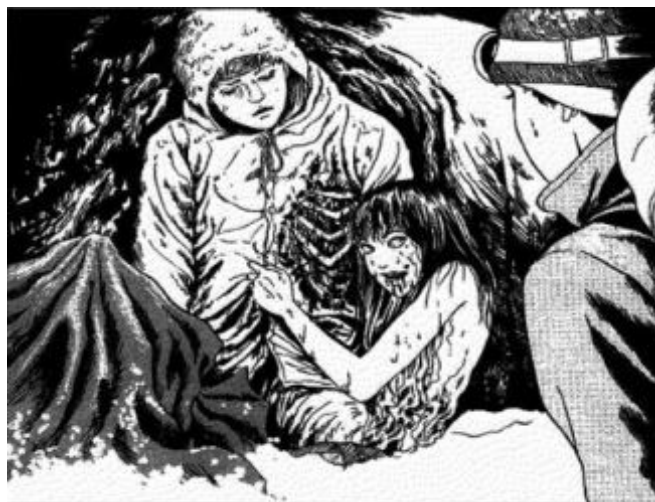
(Ito, 2021, p. 230)