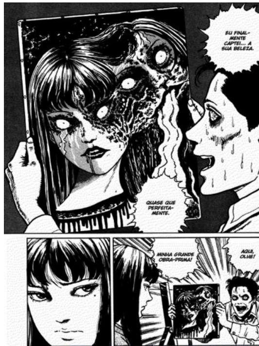
(Ito, 2021, p. 180)

Outra condição monstruosa de Tomie manifesta-se em seu canibalismo, já que, em dois momentos distintos, a personagem é apresentada consumindo carne humana. Na primeira cena, ela é mostrada devorando o tórax de um alpinista que estava sendo procurado por seu irmão após desaparecer misteriosamente. Na segunda cena, Tomie surge com o corpo deformado, presa entre rochas sob uma cachoeira depois que partes de seu corpo foram lançadas à água. Nesse local, todas as versões de Tomie alimentam-se regularmente dos corpos das pessoas que assassinam. Os quadrinhos que tornam explícita essa prática são profundamente macabros e representam um dos aspectos mais monstruosos da personagem, sobretudo porque o canibalismo é um tabu no Japão, tanto quanto no Ocidente.