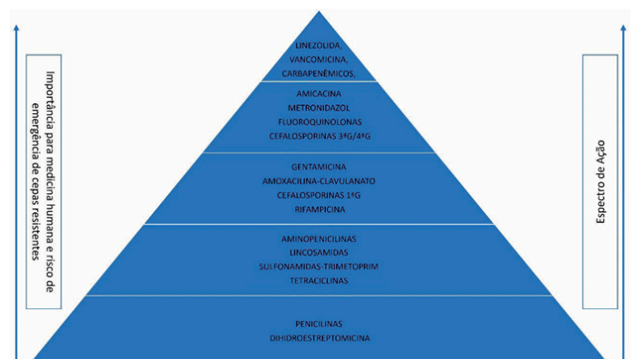
Figura 1: Escala de priorização do uso de antimicrobianos

Para reduzir a disseminação de cepas resistentes e preservar a eficácia dos fármacos, foi desenvolvida uma escala de priorização do uso de antimicrobianos que classifica os medicamentos em cinco níveis conforme sua relevância para medicina humana e riscos de indução de resistência. 2 O grupo de primeira linha inclui fármacos de espectro mais restrito e com menos impacto na seleção de resistência bacteriana, devendo ser a primeira escolha em infecções sensíveis e bem caracterizadas. A segunda linha abrange antimicrobianos de espectro intermediário, indicados quando o agente causal apresenta resistência aos de primeira linha ou quando a gravidade do quadro clínico exige cobertura ampliada. A terceira linha é indicada quando há resistência a antibióticos de primeira e segunda linha, sendo recomendado o uso de fármacos de espectro moderado. Os antimicrobianos de quarta linha destinam-se a infecções graves, resistentes às linhas anteriores, incluindo bactérias de alto potencial de disseminação. O uso inadequado nesse nível pode favorecer a RAM e representar risco zoonótico, comprometendo a eficácia clínica. Por fim, os fármacos de quinta linha são reservados para casos graves de infecções multirresistentes, sempre embasadas pela cultura e antibiograma quando não há alternativas terapêuticas disponíveis. 2 Essa escala foi desenvolvida com o objetivo de evitar a disseminação de cepas resistentes entre animais e humanos (Figura 1). 2