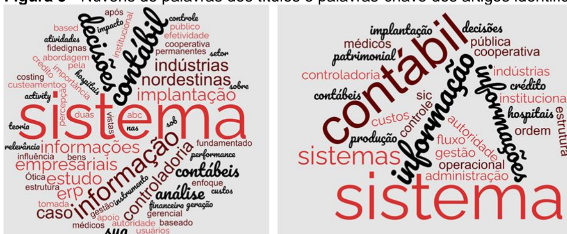
Figura 3 - Nuvens de palavras dos títulos e palavras-chave dos artigos identificados.