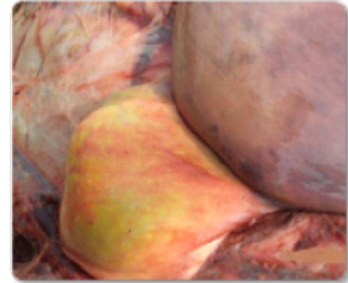
Figura 1. Lesão hepática em bovino leiteiro exposto a micotoxinas, evidenciando estase biliar e fígado de coloração pálida e hemorrágica, achados compatíveis com necrose hepática multifocal induzida por aflatoxina B1. (Fonte: Bionte, 2025)

Essas alterações histológicas estão representadas na Figura 1 , que ilustra o aspecto macroscópico de fígado afetado por aflatoxina B1.