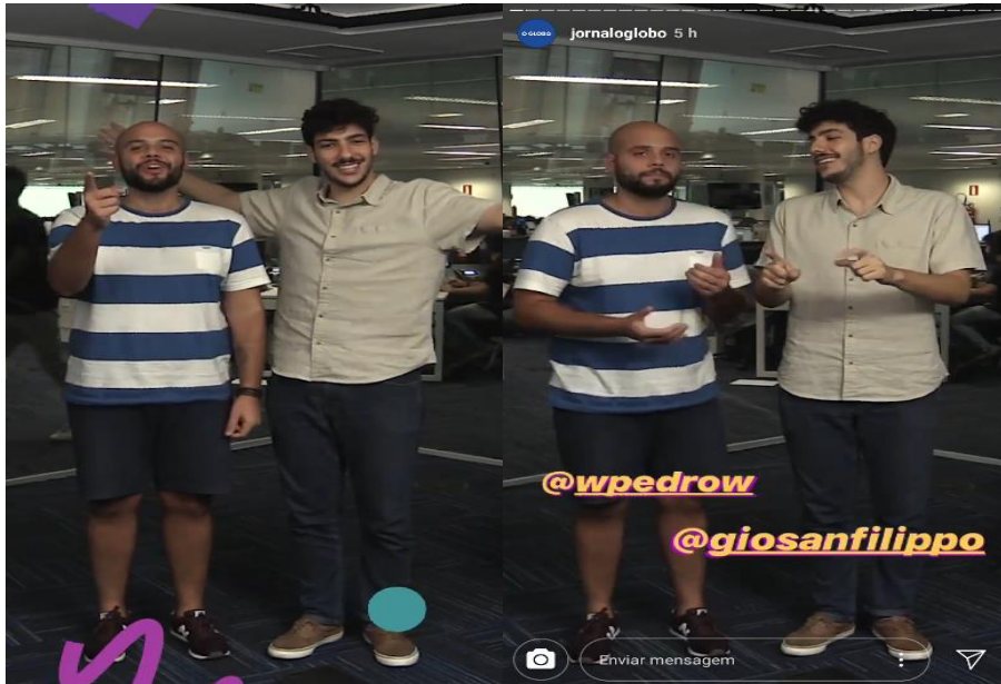
Imagem 1 – Printscreen das stories do Jornal O Globo, durante exibição do ‘Sextou’