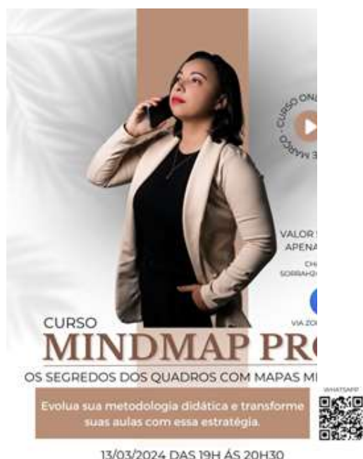
Figure 15, MINDMAP

No dia 13/03/2024, assistimos o curso on-line MINDMAP PRO: o segredo dos quadros com mapas mentais.