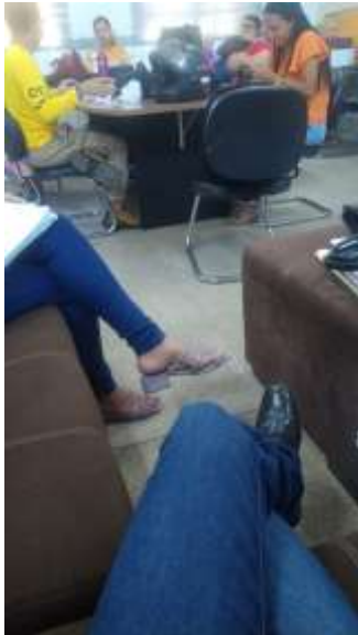
Figura 2. Reunião na Escola.