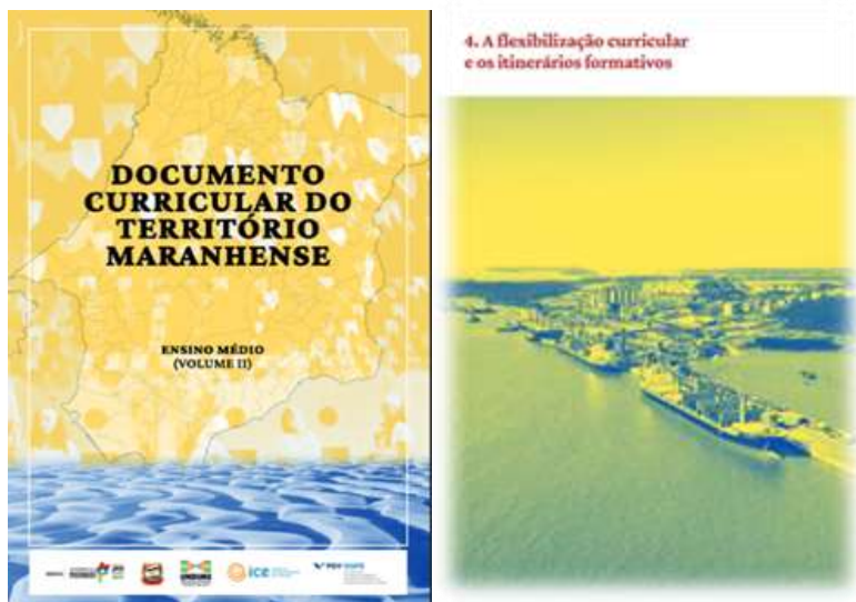
MARANHÃO. Secretaria de Estado da Educação. Documento curricular do território maranhense: ensino médio. – São Luís, 2022

Tivemos ainda como atividade a apresentação de conteúdos sobre o Novo Ensino Médio o “Documento Curricular do Território Maranhense”, na qual abordei o 4° capítulo do livro que fala sobre a flexibilização curricular e os itinerários formativos.