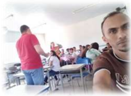
Figure 3: Roda de conversa sobre Racismo estrutural

No dia 16/06/2023, no CE Dimas Simas Lima estivemos reunidos em sala de aula para uma roda de conversa, onde o tema era Racismo Estrutural, durante esse encontro foram também debatidos as diversas formas de racismo.