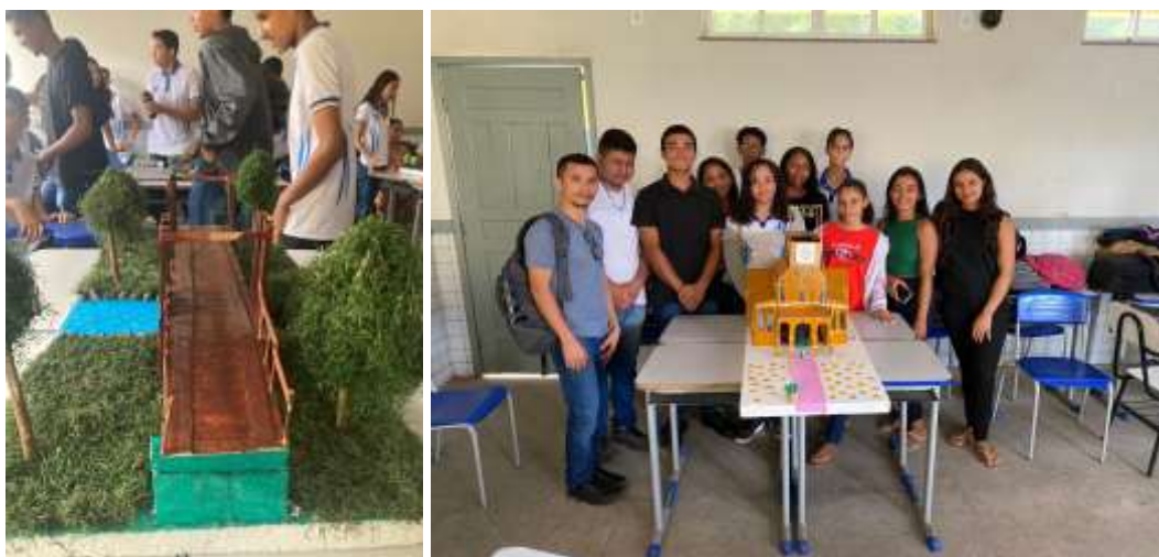
Figura 9. Apresentação de Maquetes.