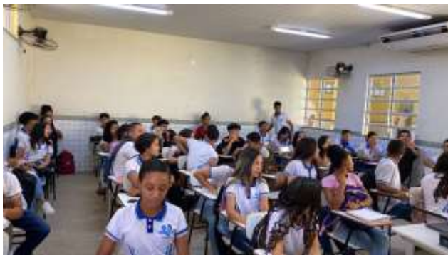
Figure 4. Aula sobre O Impacto do homem ao meio ambiente