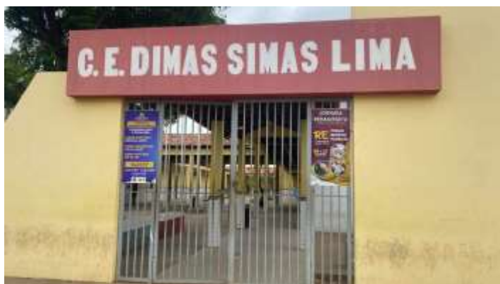
Figura 1. Escola Dimas Simas Limas