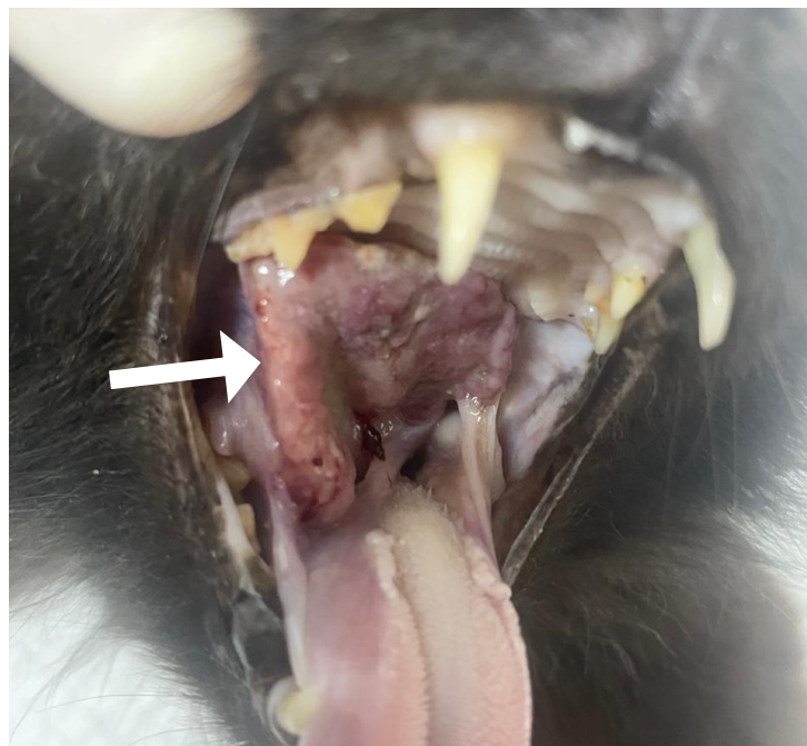
Figura 1. Macroscopia de nódulo oral em felino (seta).

Durante o exame físico, foi identificado nódulo em região oral, de consistência firme-elástica e aderido, associado a aumento dos linfonodos submandibulares, que se apresentavam palpáveis e reativos. Diante desses achados, indicou-se a realização de exames complementares para melhor caracterização da lesão e investigação de sua possível natureza inflamatória, infecciosa ou neoplásica