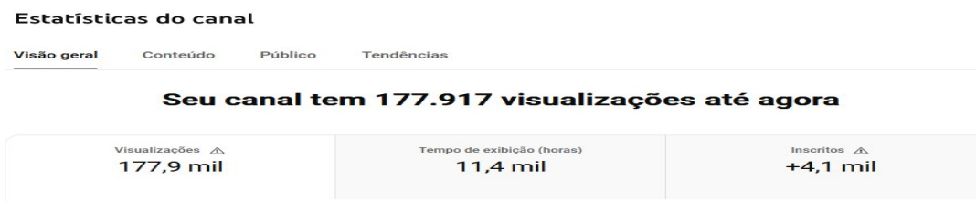
Imagem 03- Estatísticas do Canal UV – Visualizações de todo período