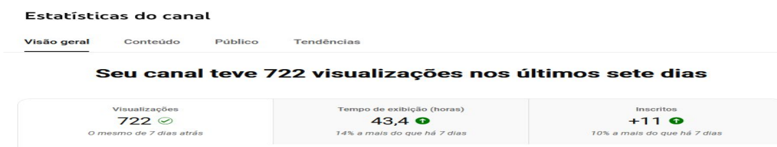
Imagem 02- estatísticas do Canal UV – Semana de 21 a 27/06/2025