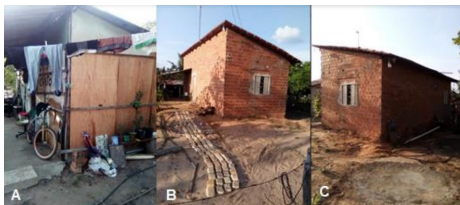
Figura 8: Casa construída em regime de mutirão

Para a construção de sua casa (figura 8), o Sr. Valdison argumenta: “O material todo foi de doação, não teve nenhum fim lucrativo não, o fim lucrativo foi só da construção mesmo que foi doação” (informação verbal, 2025).