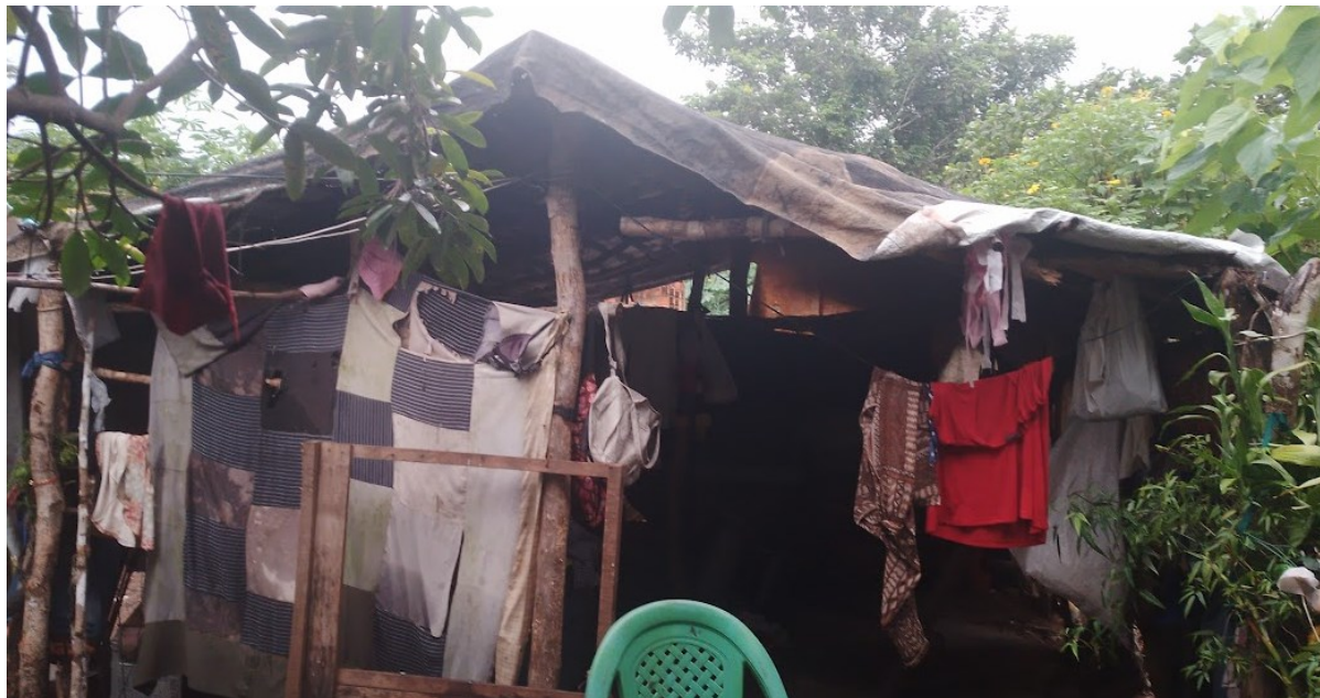
Figura 4: Barraco de lona onde morava dona Guilhermina, antes do mutirão na sua casa

Antes que tivesse sua casa construída na ocupação pelo mutirão, dona Guilhermina morava numa casa, que chama de “casa de taipa” (a casa feita de lona e madeiras), um barraco de lona (figura 4). Antes de se mudar para a comunidade Vila Jardim, Dona Guilhermina morava de aluguel no setor Santa Terezinha.