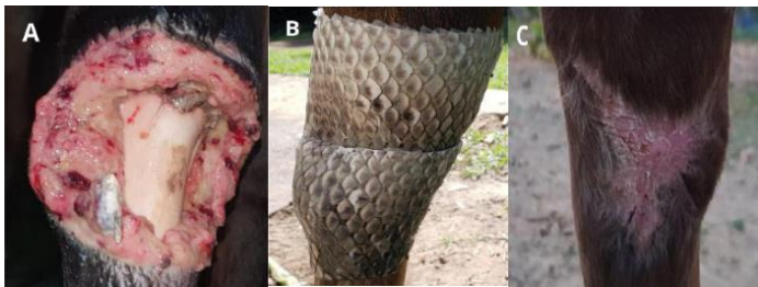
Figura 1: Curativo e evolução de ferida com uso da pele de tilápia. (Fonte: 1. SILVA, Fernanda Moreira et al. O uso da pele de tilápia como biocurativo na medicina veterinária. Studies in Environmental and Animal Sciences , v. 6, n. 3, p. e19929-e19929, 2025.)

O manejo e tratamento de feridas representam um grande desafio na rotina da medicina veterinária podendo muitas vezes até mesmo levar o animal a morte. 1 Na maioria das vezes existe a necessidade da utilização de curativos de vários tipos diferentes, neste cenário a utilização da pele da tilápia surge como uma ótima opção devido a suas propriedades regenerativas e biocompatibilidade com diferentes tipos de tecidos. 1