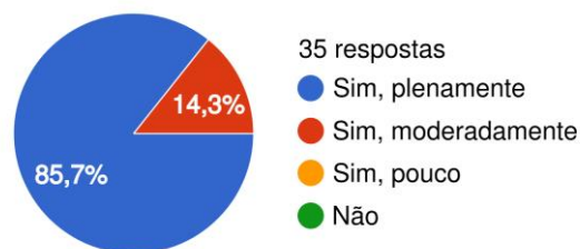
Figura 2. Respostas sobre reconhecer problemas e pensar para tomada de decisão e resolução de questões.

No reconhecimento de problemáticas e estratégias para tomada e resolução de problemas, 85,7% dos alunos concordam que a participação em EJ, enriquece essa percepção, conforme mostrado na figura 2.