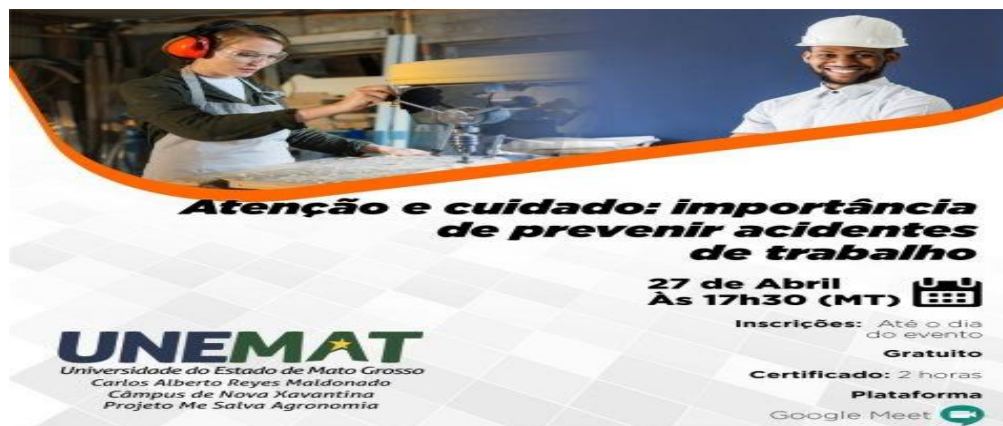
Figura 1. Arte de divulgação da palestra, Projeto de Extensão Entardecer Científico, Cáceres - MT, Brasil, 2021.