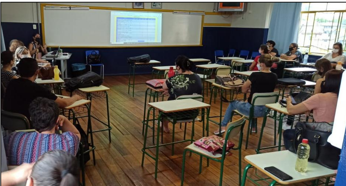
Figura 02 – Apresentação do Projeto Nós Propomos! Na Escola

O momento da apresentação da proposta para a escola foi de grande importância, pois muitas pessoas não conheciam e/ou não puderam acompanhar o desenvolvimento do projeto entre 2017 e 2019 por estarem em outras instituições de ensino ou não estarem, naquele momento, vinculados a educação.