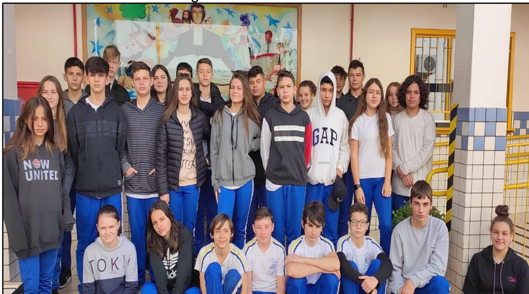
Figura 03 – Turma: 8º ano A

Abaixo fotografia dos estudantes participantes do projeto até o momento.