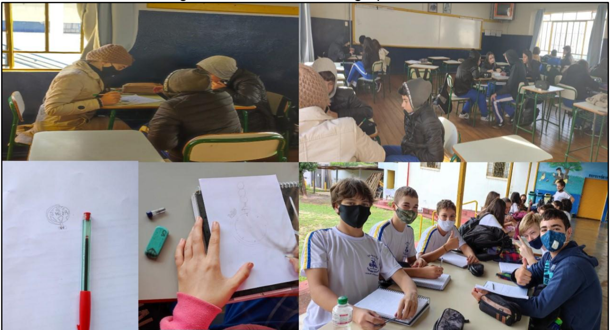
Figura 05 – Trabalhos em grupos

Os grupos desenvolveram suas atividades e escolheram o nome para representá-los, também o logotipo, como atividades extra classe.