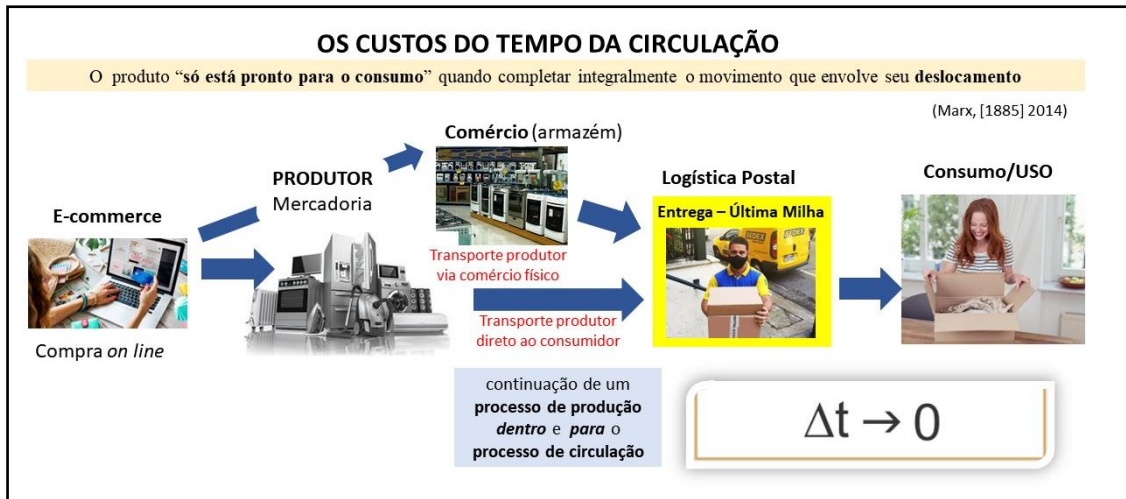
Figura 1: Os Custos do Tempo da Circulação