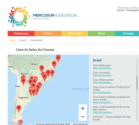
Fig. 2. Geolocalização das salas da Rede Digital de Salas – RDS.

Creio que o modelo de rede adotado e proposto pela projeto realizado pela RECAM foi verticalmente arquitetada e projetada com escalas hierarquias de controle, seguindo demandas, protocolos e necessidades copiados de modelos de redes digitais de exibição cinematográfica comercial, onde um modelo de controle vertical é justificado pela preocupação do combate à pirataria e replicação não autorizada de conteúdos proprietários, tema mui caro à indústria cinematográfica, mas que não estimula a aplicação e replicabilidade do conceito anteriormente exposto da constituição e conformação de “redes inteligentes” dinamizadas em “telas globais”. Assim nesse modelo, através de um software controlador desenvolvido exclusivamente no sistema operacional proprietário Windows, as salas de cinema integrantes da rede de exibição internacional operam única e exclusivamente como nós exibidores, recebendo o direito de exibir por tempo limitado os filmes disponibilizados num catálogo curado em processos dirigidos pelos entes cinematográficos de capa um dos quatro países, não podendo cada integrante da rede também disponibilizar diretamente conteúdos, nem estabelecendo metodologias de curadorias colaborativas em redes horizontais e sem escalas.