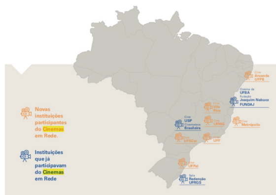
Fig. 1. Geolocalização das salas do Cinemas em Rede.

No mesmo documento que relata as atividades do projeto no ano de 2016, quando ocorre a sua ampliação, apontamos a seguir a média dos dados operacionais e do escopo e potencial de alcance do projeto. Naquele ano “foram realizadas nove exibições de filmes, que contaram com público de 1.542 pessoas. Desse total, 683 participaram dos debates que aconteceram após o filme (...) pelo serviço de Conferência Web da RNP” (idem).