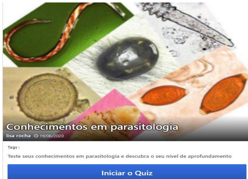
Figura 1. Página inicial do quiz sobre conceitos em parasitologia feita no semestre

Outra forma de auxiliar no aprendizado foi a criação de uma conta em uma rede social (Instagram) para a monitoria, na qual foram realizadas postagens referentes aos assuntos ministrados nas aulas pela professora do curso. As postagens eram compostas por vídeos e fotos com os conteúdos escolhidos, além da utilização dos stories para fazer quiz, visando a dinamização dos assuntos.