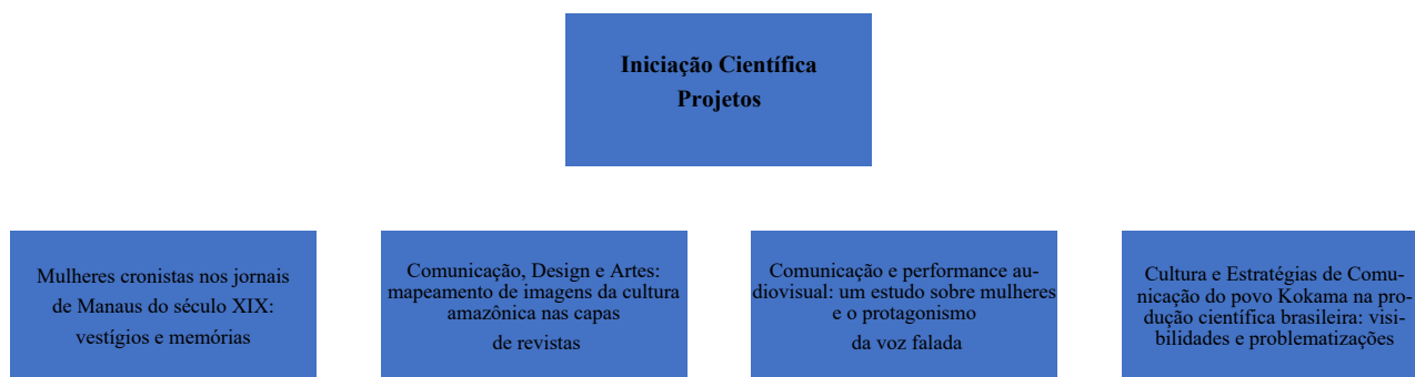
Figura 2 - Projetos do Programa Institucional de Bolsas de Iniciação Científica (PIBIC 2025-2026)

em cada trabalho, tais como a voz falada na performance de poesias, os sons em evidência na cultura Kokama, os textos de mulheres cronistas para serem lidos em voz alta, e as possibilidades de interação sonora em uma revista de cultura e arte.