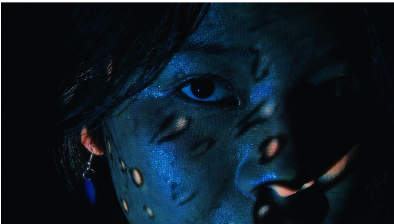
Figura 1 – Ensaio Fotográfico “Ar, Terra, Água e Fogo”

Destaca-se ainda o trabalho com a linguagem fotográfica e audiovisual, iniciado nas aulas de teoria e estética da imagem, com estudos preliminares de luz e sombra, o qual foi estendido para a produção de autorretratos, em um processo de criação com mais de mil fotografias tiradas e a curadoria para um ensaio fotográfico denominado “Ar, Terra, Água e Fogo”, além de um vídeo de apresentação das componentes do Laboratório. Estes produtos foram exibidos no evento “Alquimias de Som e Imagem”, realizado no Centro de Artes da Universidade do Amazonas (CAUA), em parceria com o grupo de pesquisa Tamurá – estudos e pesquisas em cultura e desafios amazônicos, da Faculdade de Artes da UFAM.