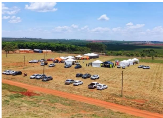
Figura 1. Foto capturada por um drone na Feagro 2023.

adoção de novas práticas agrícolas, contribuindo para o desenvolvimento do agronegócio regional. Além de ser uma plataforma para negócios e networking, a FEAGRO promove a interação entre produtores, empresas e universitários, impulsionando a inovação e a aplicação de tecnologias avançadas no campo. O levantamento dos visitantes e expositores indicou um alto nível de satisfação, com diversos comentários positivos, destacando a qualidade do evento e seu papel na difusão de tecnologias.