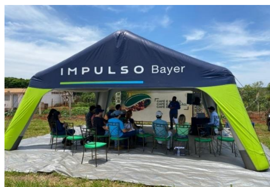
Figura 2. Foto do estande da bayer na Feagro 2022