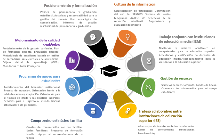
Figura 1. Componentes y herramientas para la permanencia estudiantil.

y operativamente las 37 herramientas para mitigar la deserción estudiantil en la educación agrupadas en las ocho componentes que se resumen en la Fig. 1.