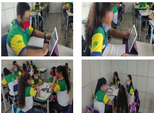
Figura 2: Estudantes produzindo o jogo lixo zero

A elaboração dos jogos possibilitou aos estudantes assumirem um papel importante na construção do conhecimento, como realizadores, aprendizes e autores na elaboração do jogo interativo, pesquisando informações referentes ao conteúdo, refletindo sobre os questionamentos, realizando leituras, planejando e produzindo de forma colaborativa. Utilizando as tecnologias digitais na produção, divulgando e participando de debates de forma coletiva e reflexiva. Os mesmos construíram os conhecimentos proposto no ensino de ciências por investigação, trouxeram para a prática o conteúdo curricular estudado e com isso reforçaram a discussão em torno do ensino de ciências por investigação.