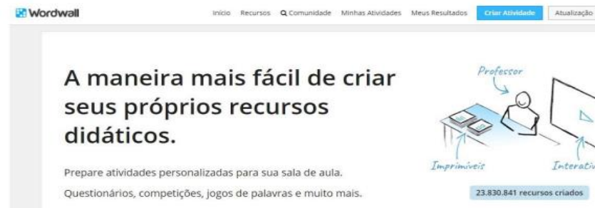
Figura 1 – Plataforma Wordwall

Observe a quantidade de lixo produzido durante o dia em sua casa e a maneira como esse lixo é descartado. Os estudantes trouxeram suas reflexões e com isso conhecendo mais sobre o tema.