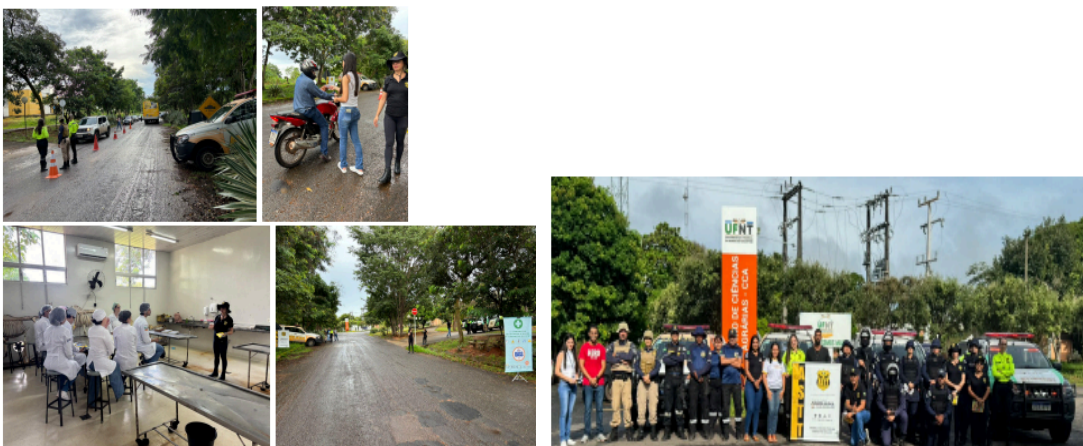
Figura 5. Momentos do quarto encontro

Blitz Educativa, com o tema Respeito e Responsabilidade no Trânsito, realizada em parceria com os órgãos de trânsito: ASTT, Detran e BPMRED. ( figura 5)