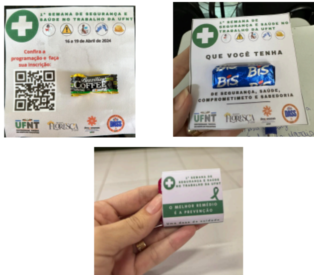
Figura 1. Convite e brinde aos participantes.

O recurso financeiro foi utilizado para custear os convites, banners, brindes aos participantes ( figura 1), coffee break, locação de som e materiais dos treinamentos. A divulgação do evento ocorreu via e-mail, redes sociais, banners e panfletagem realizada pela equipe da organização e todos os interessados foram orientados a realizarem inscrição em formulário próprio, para posterior emissão de certificado.