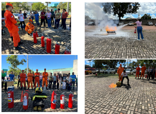
Figura 3. Momentos do Segundo encontro

Treinamento de Prevenção e Combate a Incêndios (NR-23), realizado em parceria com o Corpo de Bombeiros do Tocantins e coffee break.( figura 3)