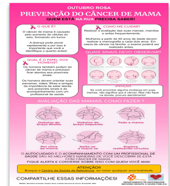
Cartaz CA. de Mama