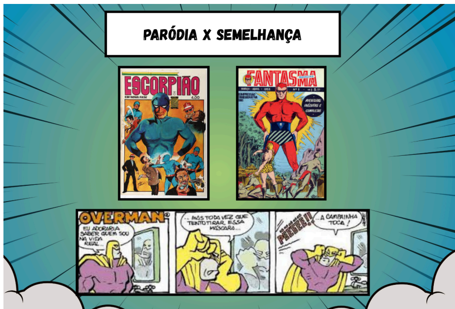
Figura 2- Overman, Escorpião e Fantasma.

Fonte: montagem dos autores, online, 2026.