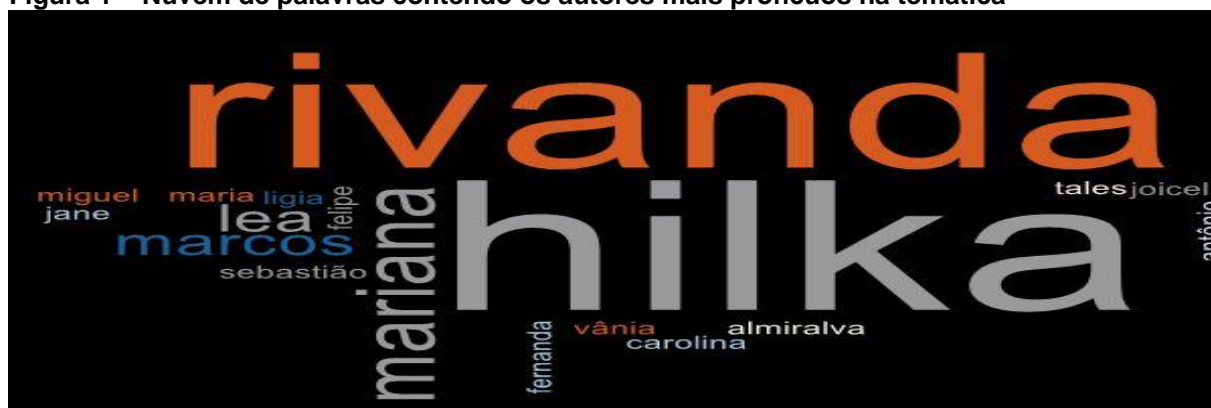
Figura 1 – Nuvem de palavras contendo os autores mais profícuos na temática