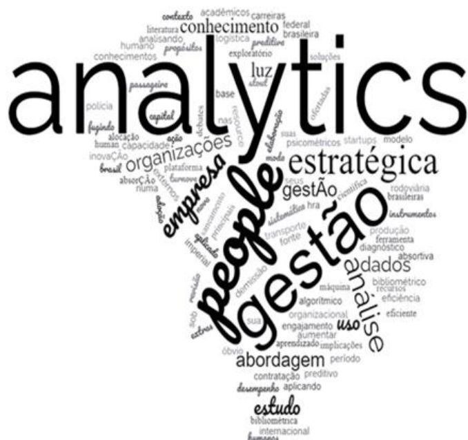
Figura 3 - Nuvens de palavras dos títulos dos documentos identificados sobre People Analytics .