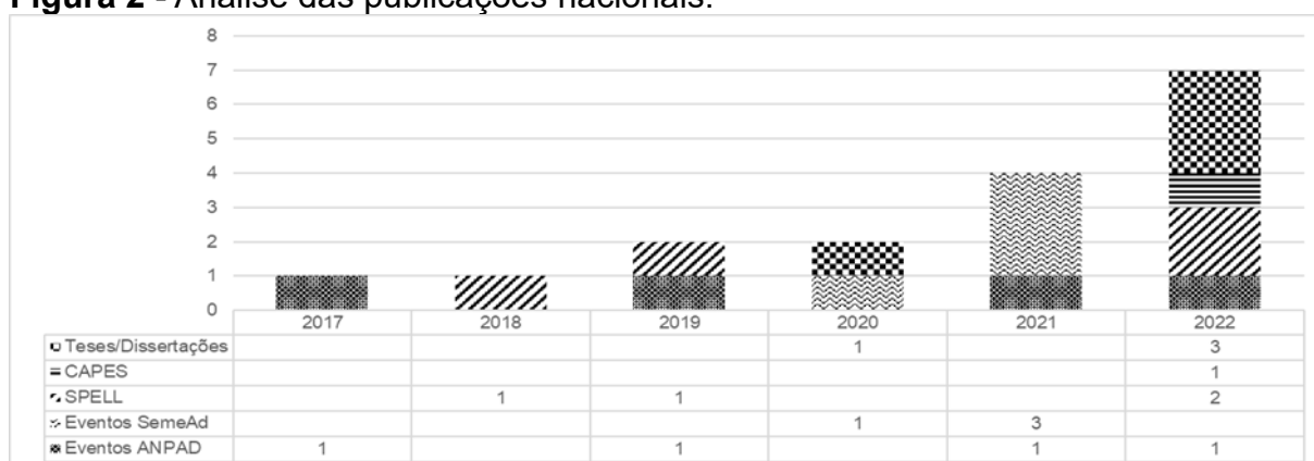
Figura 2 - Análise das publicações nacionais.