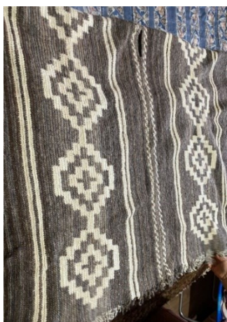
Figura 1 - Pala produzido com a técnica Jacquard