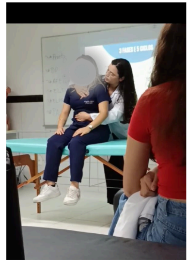
Imagens 7, 8 e 9: práticas no laboratório de fisioterapia.