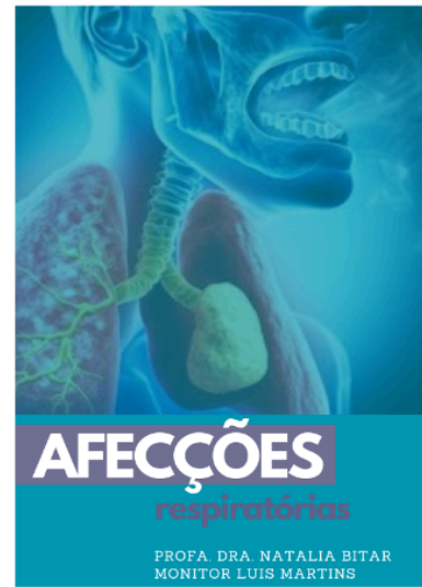
Imagens 1 e 2: postagens no instagram. Imagem 3: ebook afecções repiratória.