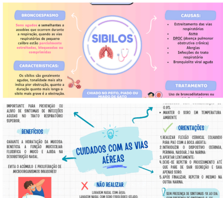
Imagem 4: quizz no instagram. Imagens 5 e 6: mapa mental.