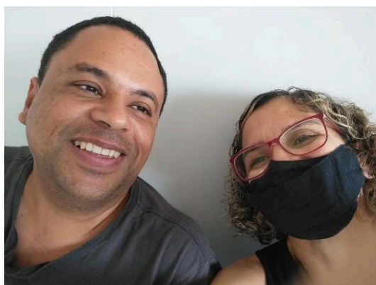
Figura 1 - Selfie Tutora mediadora e aluno