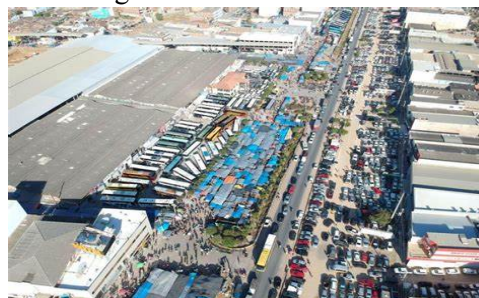
Imagem – 1 A feira de Toritama

Trago a essa discussão o intermédio de dois deles, a iniciativa privada e o estado na esfera municipal, o cerne da questão exemplifica-se na realidade da cidade de Toritama – PE, onde ambos os agentes andaram provocando várias mudanças na paisagem urbana. A exemplo da mudança incentivada pelo executivo de tirar os feirantes da frente do polo, e serem realocados para outros lugares, conforme a imagem 1 e 2 retrata a seguir.