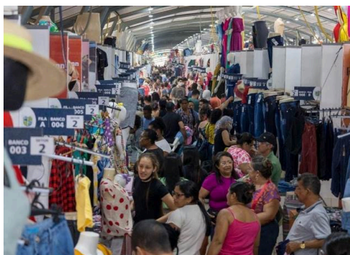
Imagem 3 – A reorganização da feira

Ambas as imagens reafirmam a preocupação do poder público vigente em retirar aqueles feirantes que ali estavam situados em frente ao polo parque das feiras, e realocá-los para as adjacências do entorno. Deixando o foco principal o aparato da iniciativa privada. O problema é que essa realocação foi proposta em ruas de passagem ao lado do polo, concentrando e apertando todos os comerciantes em três espaços que não tem a mínima condição de mantê-los, a justificativa que mascara a real intenção foi a organização da feira. A imagem 3 expressa como essa organização está posta diante do espaço urbano.