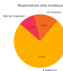
Gráfico 2: Quem são os Responsáveis pela mudança da feira?