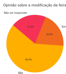
Gráfico 1: A percepção popular sobre a modificação da feira.

Conforme os resultados dos gráficos 1, 2 e 3