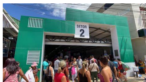
Imagem 2 – Nova Feira de Toritama