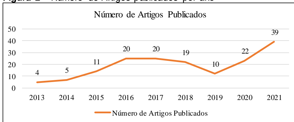
Figura 2 – Número de Artigos publicados por ano

Esta seção apresenta a análise dos artigos selecionados com base nas categorias previamente definidas (Tabela 2). Na figura 2 são apresentadas a quantidade dos artigos publicados, anualmente, no período de 2013 a 2021.