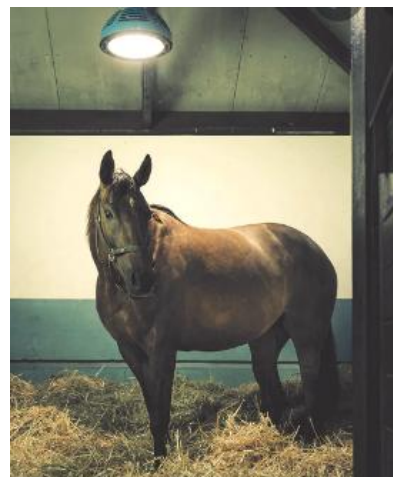
Figura 1: Égua na luz artificial. 10 .

O período a se utilizar da iluminação artificial irá ser determinado com o tempo desejado para a ovulação do animal. Observou-se em trabalhos recentes a utilização de luz artificial no período de 17 as 22:00 (5 horas dia), com animais ciclando a partir de 35 a 40 dias após o início do protocolo 9 (Fig. 1).