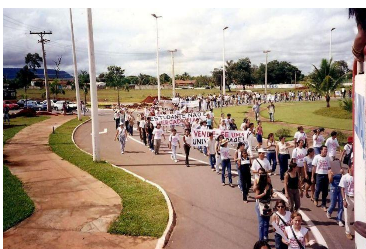
Imagem 1 - Ato de rua SOS UNITINS