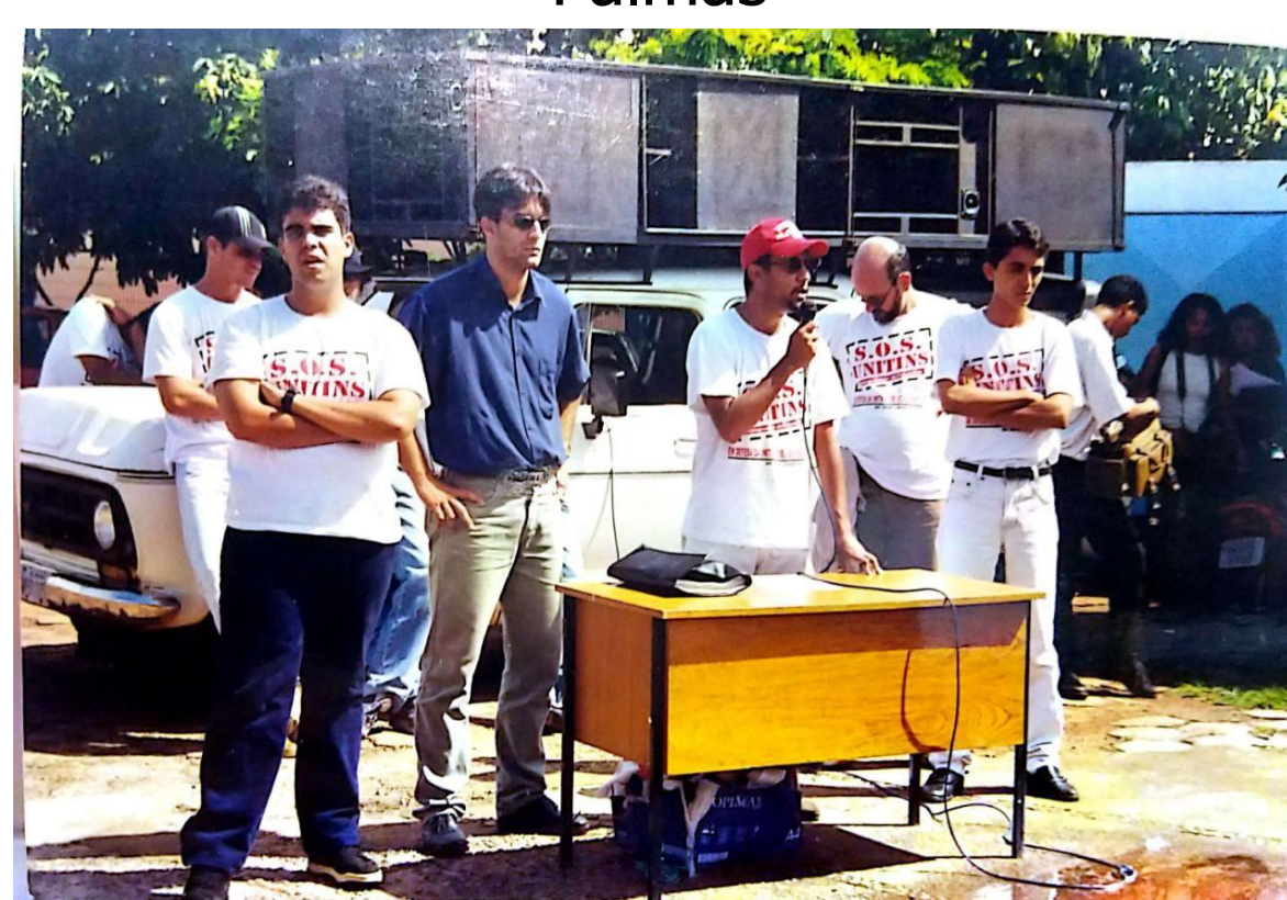
Imagem 2 - Assembleia geral Campus Palmas