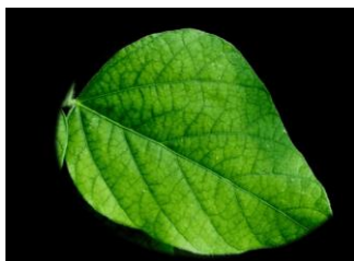
Figura 2: Sintomas da Toxidez de Ni em soja, caracterizada pela manchas cloróticas entre as nervuras.

Por fim, é crucial considerar o excesso, pois a toxidez de níquel produz sintomas de clorose, geralmente semelhantes à deficiência de ferro ou manganês. Em dicotiledôneas, isso se manifesta como manchas cloróticas entre as nervuras (Figura 2), sendo um desafio de diagnóstico em campo 2,8 .