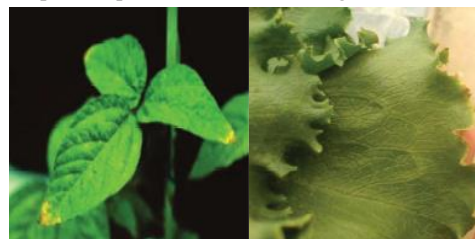
Figura 1: Esquerda: danos necróticos nas pontas da folha de soja ( Glycine max ). Direita: danos necróticos nas bordas das folhas de alface ( Lactuca sativa ). Ambos com deficiência de níquel.

dos folíolos (Fig. 1). Outros sinais de deficiência incluem a redução do tamanho da folha, abortamento da ponta das folhas (dando a aparência de "orelha de rato" em casos severos) e a antecipação da senescência. Em culturas como a soja, esse efeito é intensificado na aplicação foliar de ureia em plantas com baixo suprimento de Ni, reforçando a importância do micronutriente para o aproveitamento do nitrogênio 1,2,4,8 .