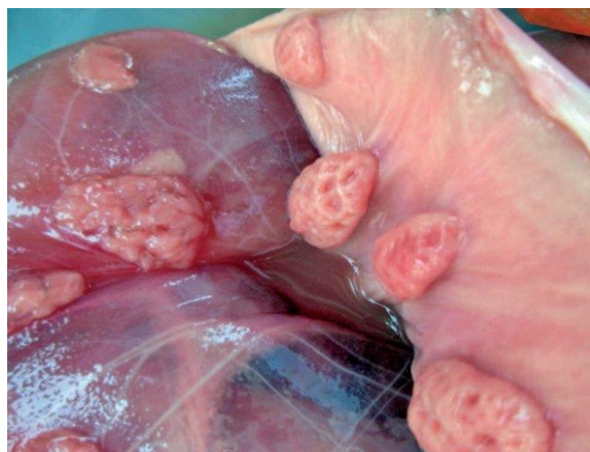
Figura 2: O placentoma é uma unidade funcional da placenta, formada pela união do cotilédone, do lado fetal, e da carúncula, do lado materno.

Outro fator predisponente para a ocorrência de freemartinismo é a placentação cotiledonária, característica da espécie bovina. Nesse tipo de placenta, a troca de substâncias entre mãe e feto ocorre por meio de múltiplas unidades chamadas placentomas, formadas pela união dos cotilédones fetais com os carúnculos uterinos 9 .