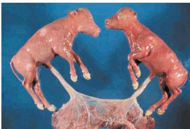
Figura 1. Anastomose vascular placentária de fetos bovinos. Fonte: Robert A. Foster, Departamento de Patologia, Faculdade de Veterinária de Ontário, Universidade de Guelph - Apud. Ayala - Valdovinos et al. (2011)

Nessas situações, forma-se uma comunicação vascular entre as placentas — as chamadas anastomoses coriônicas — que permitem a troca de células e hormônios entre os fetos antes da diferenciação completa das gônadas da fêmea 3 . Como resultado, o desenvolvimento do trato reprodutivo feminino é influenciado por fatores masculinos, levando às alterações anatômicas e fisiológicas típicas do freemartinismo.