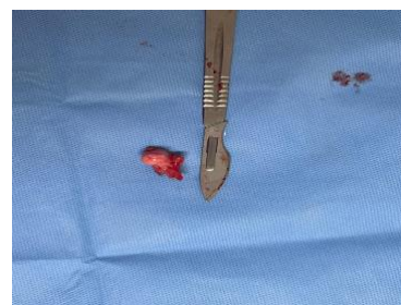
Figura 2: Remoção do processo ancôneo frouxo.

A artrotomia, procedimento indicado para a remoção do processo ancôneo frouxo ou solto, foi realizada 64 dias após a consulta inicial. No bloco cirúrgico, a paciente recebeu oxigênio 100%, anestesia inalatória e bloqueio locorregional para promover analgesia do membro torácico utilizando-se propofol (4-6 mg/kg, IV) para indução, isoflurano para manutenção e bloqueio do plexo braquial com lidocaína (2 mg/kg) associada a bupivacaína (1 mg/kg). A cadela foi posicionada em decúbito lateral direito, realizando-se uma abordagem medial da articulação do cotovelo. Foi efetuada a exposição e incisão do músculo ancôneo e da cápsula articular, permitindo a visualização e remoção do fragmento ósseo com o auxílio de uma pinça. Em seguida, procedeu-se à sutura da cápsula articular e do músculo ancôneo em uma única camada, visando o fechamento anatômico da articulação (Fig. 2).