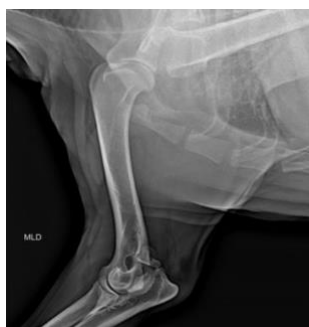
Figura 1: O raio-X apresentando linha radiotransparente no processo ancôneo, com afastamento entre os fragmentos ósseos (Fonte: Arquivo próprio).

Durante o exame físico, a cadela apresentou-se reativa, de difícil manipulação e com desconforto acentuado à movimentação e palpação da articulação afetada. O exame radiográfico realizado previamente revelou uma linha radiotransparente no processo ancôneo, com afastamento entre os fragmentos ósseos, enquanto as demais estruturas ósseas apresentavam-se dentro dos limites da normalidade radiográfica. Foram solicitados exames laboratoriais complementares e uma tomografia computadorizada, a qual revelou a presença de um fragmento ósseo na região articular do cotovelo, localizado no processo ancôneo, medindo aproximadamente 1,6 cm x 1,4 cm x 0,9 cm (comprimento x altura x largura). O achado tomográfico foi compatível com a formação de um osteófito no processo ancôneo, responsável pelos sinais clínicos observados (Fig. 1).