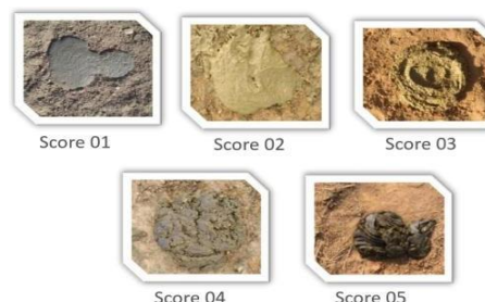
Figura 1: Guia de Escore de fezes.

A migração de sistemas extensivos para o confinamento aumenta a densidade animal, altera a dieta e intensifica o estresse fisiológico, fatores que podem comprometer a saúde e o desempenho dos bovinos. Nesse cenário, a avaliação do escore de fezes, (Figura 1) torna-se uma ferramenta prática, pois reflete diretamente o impacto da alimentação e das condições metabólicas sobre o trato digestivo.