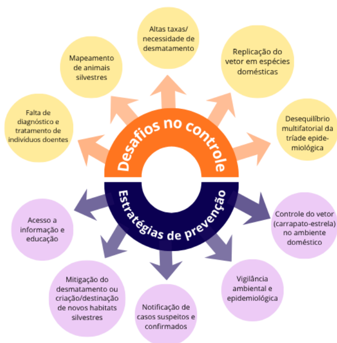
FIGURA 2: Representação visual dos principais desafios no controle da FM do contexto apresentado, bem como as principais estratégias de prevenção identificadas.